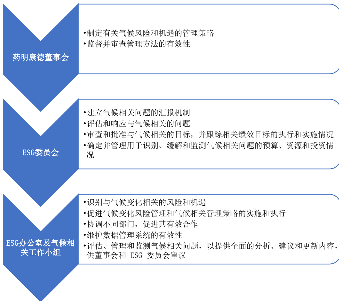
药明康德气候变化治理架构

药明康德高度重视气候变化治理工作，不断完善内部管理机制和方法，持续提高气候变化治理的有效性。我们搭建了由董事会、ESG 委员会、ESG 办公室及气候相关职能部门组成的气候变化治理架构。ESG 委员会在整合 ESG 办公室的季度汇报成果后，将定期向董事会进行汇报。